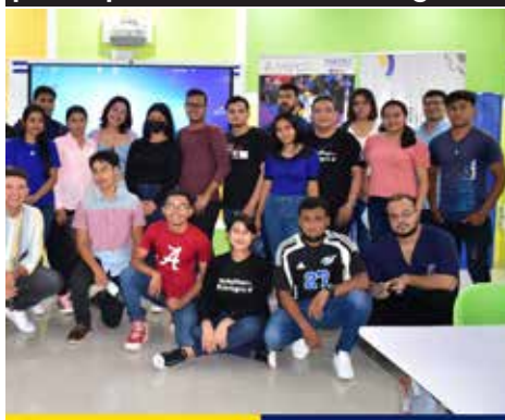
La Bicentenario UNAN-León participó en el Brainstorming 2022