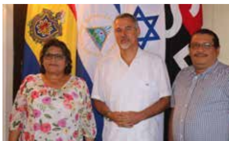
UNAN-León recibe visita de Embajador de Israel en Nicaragua

La Bicentenario Universidad Nacional Autónoma de Nicaragua, UNAN-León, se galardonó con la visita del Embajador de Israel en Nicaragua, compañero Oren Bar-El.