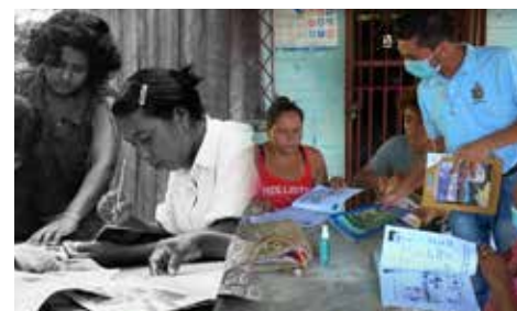
A 42 años del cierre de la Gran Cruzada Nacional de Alfabetización

La Bicentenario Universidad Nacional Autónoma de Nicaragua, UNAN-León, se galardonó con la visita del Embajador de Israel en Nicaragua, compañero Oren Bar-El.